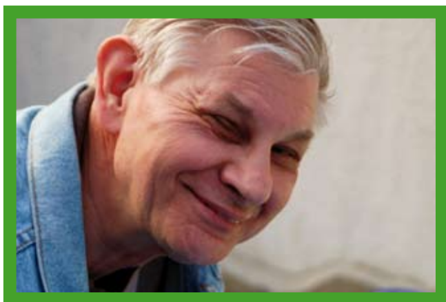
Hans-Peter Herchenröder (Sprecher)